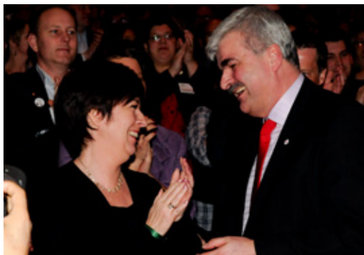
Håkan Juholt gratuleras som nyvald partiordförande av Mona Sahlin.

2011 års mest uppmärksammade händelse var förstås att partidistriktets ordförande Håkan Juholt i november valdes till partiordförande. Han avgick 10 månader senare efter en exempellös mediekampanj mot honom och inre stridigheter i partiet. När han avgått skrev distriktsstyrelsen att Håkan gjort mycket stora insatser för partiet. Han besökte samtliga partidistrikt i landet och fick ett stort gensvar. Här i Kalmar län togs han emot av flera hundra jublande supportere på Flanaden i Oskarshamn den 17 december. Han gjorde en av sina bästa debatter när han mötte partiledarna i riksdagen. Självklart påverkade denna enormt negativa mediebevakning förtroendet både för vår partiordförande och för partiet i stort.