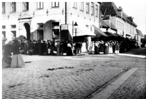
Kalmar under hungeråret 1917, hörnet Larmgatan – Storgatan. Köer för livsmedelstildelning.