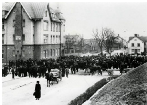
Hungerdemonstration i centrala Västerwik samma år.

folket. Folkmassan lugnade sig och upplöstes. Liknande hungerdemonstrationer genomfördes på många håll i landet, bland annat i Västerwik.