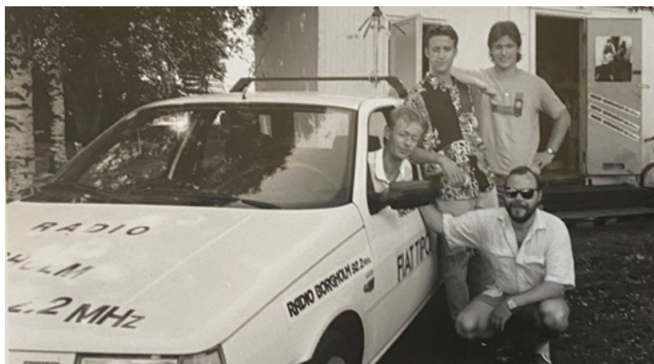
Medarbetare utanför LO:s närradiostudio i Borgholm.

När lokal radioverksamhet möjliggjordes i mitten på 80-talet tog LO-distriktet snabbt upp bollen. Distriktet blev den största aktören vid sidan om public service vid den här tiden med Radio Borgholm.