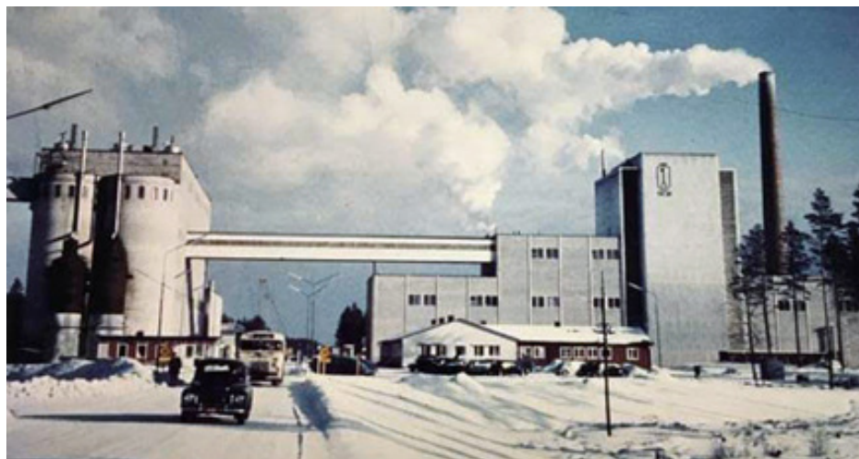
År 1958 startade Mönsterås bruk sin tillverkning av pappersmassa. Fabriken hade då en produktionskapacitet på 85 000 ton per år, vilket kan jämföras med dagens Södra Cell som producerar ca 750 000 ton per år. I slutet av 1990-talet stod också ett sågverk klart vid bruket. Södra Cell sysselsätter ca 400 personer vid sin anläggning. Från ett vykort på 1960-talet

Under 1950-talet genomgick dåvarande Mönsterås köping en kraftig förvandling. Från att ha varit en landsbygdskommun skedde en snabb tillväxt och flera industriföretag etablerade sig i kommunen. 1951 kom STECES fjäderfabrik flyttades med båt från Stockholm. Södra skogsägarnas massafabrik startade sin produktion 1958 och hade då en produktionskapacitet på 85 000 ton per år. Antalet anställda uppgick till en början till 230 personer. Efterhand har kapaciteten byggts ut och idag uppgår den till 750 000 ton per år. Andra större etableringar var bland annat Allack, Groths karosserier och en skjortfabrik.