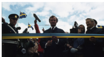
Dåvarande Kronprins Carl Gustaf klipper bandet vid invigningen av Ölandsbron.

År 1972 präglades av två spektakulära händelser i Kalmar län. Den 30 september klippte kronprins Carl Gustaf bandet mitt på den färdigställda Ölandsbron och kung Gustav VI Adolf invigde Sveriges första kommersiella kärnkraftverk utanför Oskarshamn. Visserligen hade kraftverket Oskarshamn 1 fasats in på nätet år 1971 men den officiella invigningen skedde den 8 maj 1972. Vad kungen inte visste var att en turbin hade havererat, så någon egentlig start blev det inte men invigning blev det ändå. Det var kulmen på ett 20-årigt projekt som blev konkret när Atomkraftkonsortiet AKK år 1962, med Krångede och Sydkraft som största delägare, köpte Simpevarps by i Misterhults kommun. Efter kommunsammanläggningen 1967 tog Oskarshamns kommun över det lokala ansvaret.