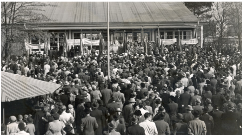
Folkets Park i Kalmar 1950. LO-ordförande Axel Strand talar på 1 maj..