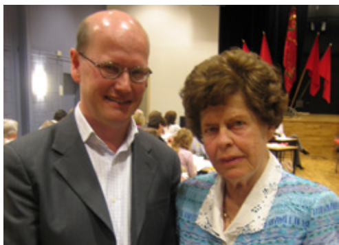
Statsrådet Thomas Östros och före detta kommunalrådet Birgit Franzén i samband med utdelningen av Tage Erlanders hedersmedalj 2007