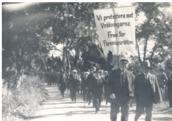
Demonstration för föreningsrätt och mot vräkningar 1929 i Mörebygden.

Östra Småland satte då sin första helsidesrubrik med orden ”Dådet har nu fullbordats!”