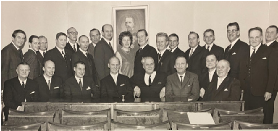
Fagerhult Kommunalfullmäktige 1967 – 1968