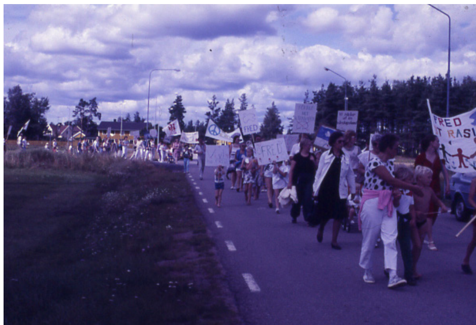
Bild från fredsfestivalen i Hultsfred i början av 1980-talet.

Två år i rad var Hultsfred den arbetarekommun i distriktet som hade flest medlemmar i politiska studiecirklar. Förutom studier hölls informationer på medlemsmöten om bland annat löntagarfonder och yttrandefrihetsutredningen. Arbetsgrupper för miljö- och fredsfrågor bildades. I början av 1980-talet var arbetarekommunen medarrangör för en fredsfestival i Folkets Park vid sjön Hulingen.