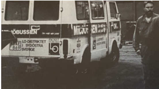
LO:s miljöbuss vid ett företagsbesök.

I slutet på 80-talet köptes och iordningsställdes en miljöbuss. Den var utrustad för testning av vatten och jord, gjorde bullermätningar, freonläckagesökning och gasspårning m.m.