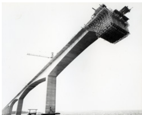
Vy från byggandet av Ölandsbron. Här ser man hur vägbanan på högbron gjuts från vagnar som, hängande under bron, matades fram från pelare till pelare. I bildens vänstra nederkant syns den tillfälliga vägbank som byggdes från Svinö och ut i sundet.