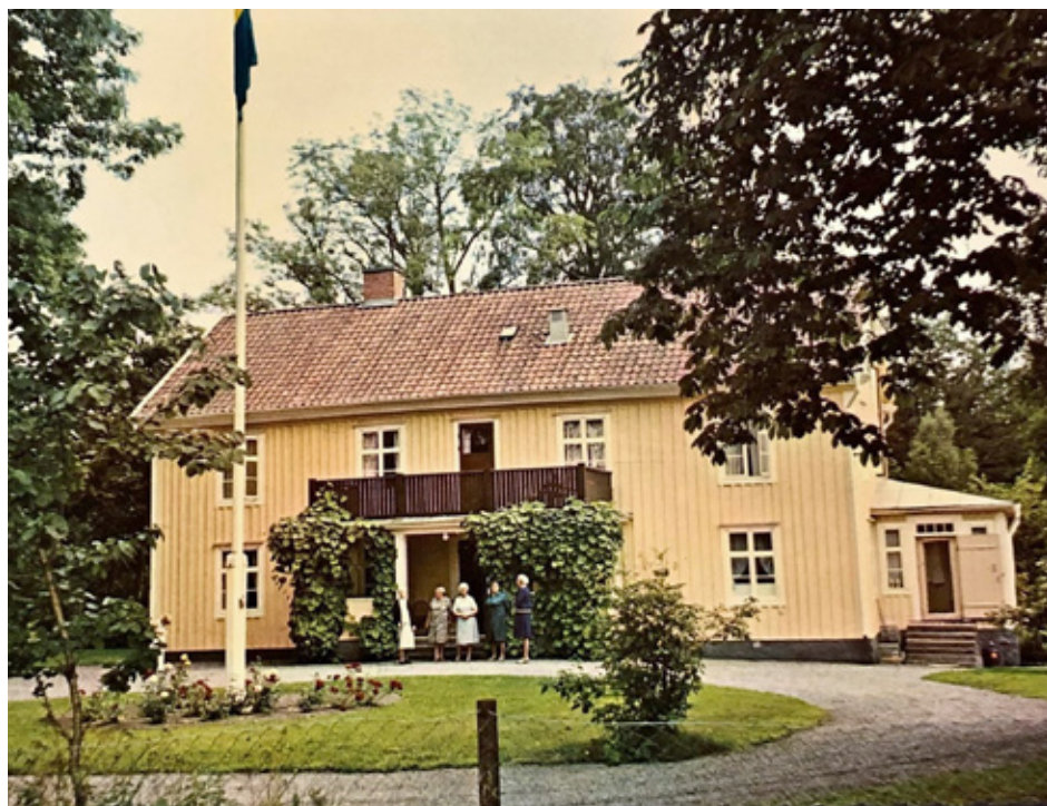
Kvinmodistriktet drev under många år semesterhemmet Lilla Forsa som låg utanför Mönsterås.

Semesterhemmet Lilla Forsa i Mönsterås kommun ägdes och drevs med ideella krafter av kvinnoklubbarna. Arbetarkvinnor erbjöds en semestervecka där under sommaren men allt eftersom vi svenskar fick det ekonomiskt bättre så minskade antalet besökare och hemmet blev allt mer ett billigt semesterställe för damer från Stockholm. 1980 avvecklades hemmet och en annan social verksamhet tog över, ett kollektiv för missbrukande ungdomar startade på Lilla Forsa.