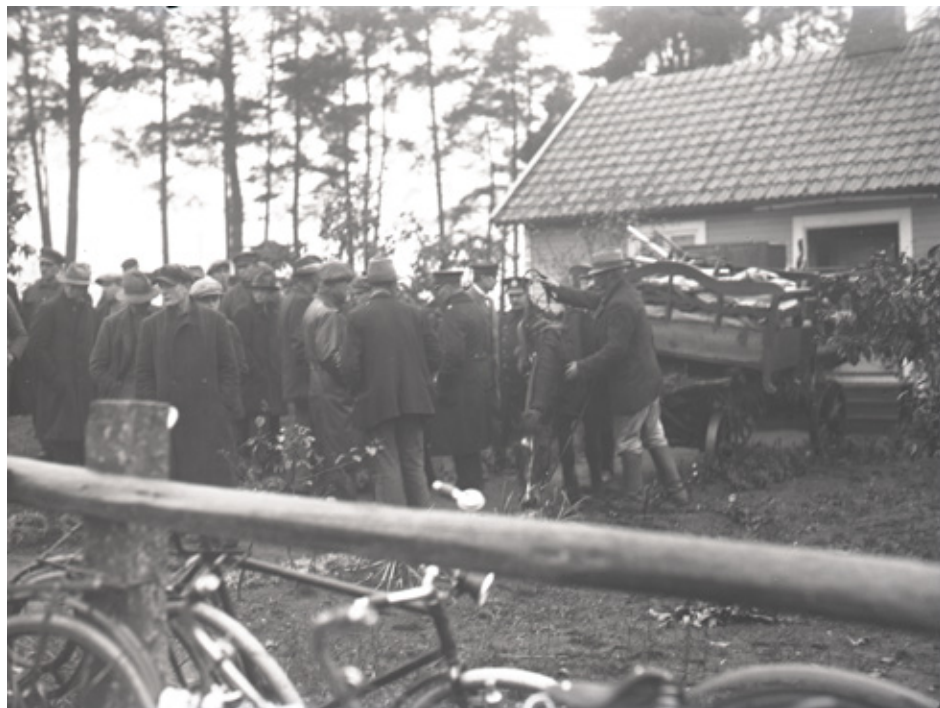
Fotografi från en vräkning av statare i Ljungbyholm år 1929.

Livet var fortfarande mycket hårt för stora grupper i samhället, särskilt för statarna och lantarbetare. 1929 vräktes många av dem i Ljungbyholm från sina bostäder och sitt uppehälle. Demonstrationer utbröt och den så kallade Södra Mörekonflikten pågick till 1932. Man kan förstå att det var förhållandevis lätt att få gehör för en socialdemokratisk politik som lovade ekonomiska och sociala reformer.