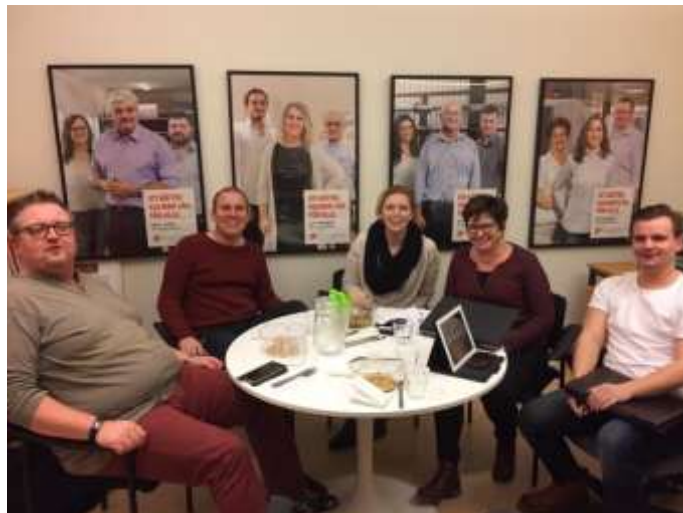
Möte med utvecklingsledarna