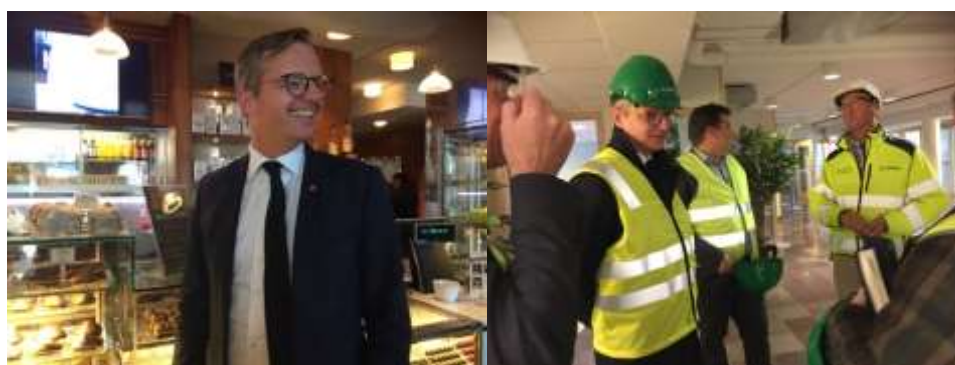
Mikael Damberg i Oskarshamn

19 september, Mikael Damberg besökte Oskarshamn och Mönsterås. Besök på bland annat Södra Cell, OKG och Nilssons konditori. Öppet möte med näringslivet och allmänheten avslutade den lyckade dagen.