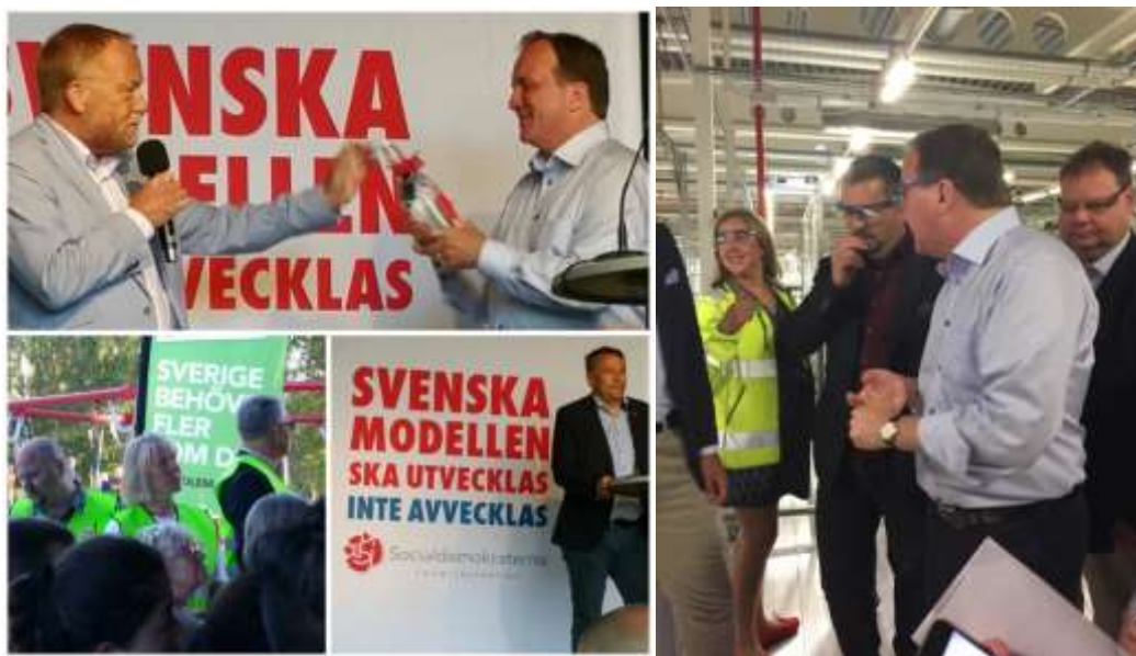
Stefan Löfven på Scania och Böda Sand

4 juli, Stefan Löfven till Oskarshamn och Böda Sand. Från en ö till en annan på Almedalsveckan, vilket var ett lyckat besök. Solen strålade och det gjorde även Statsministern. Besök på Scania, färjan till Öland och öppet möte på Böda Sands camping.