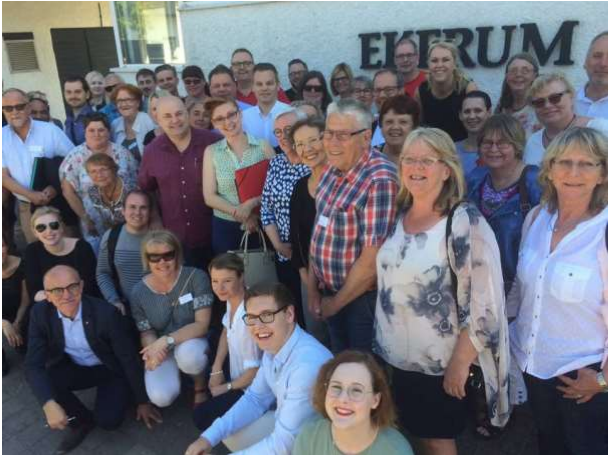
Nu kör vi mot valvinst 2018!