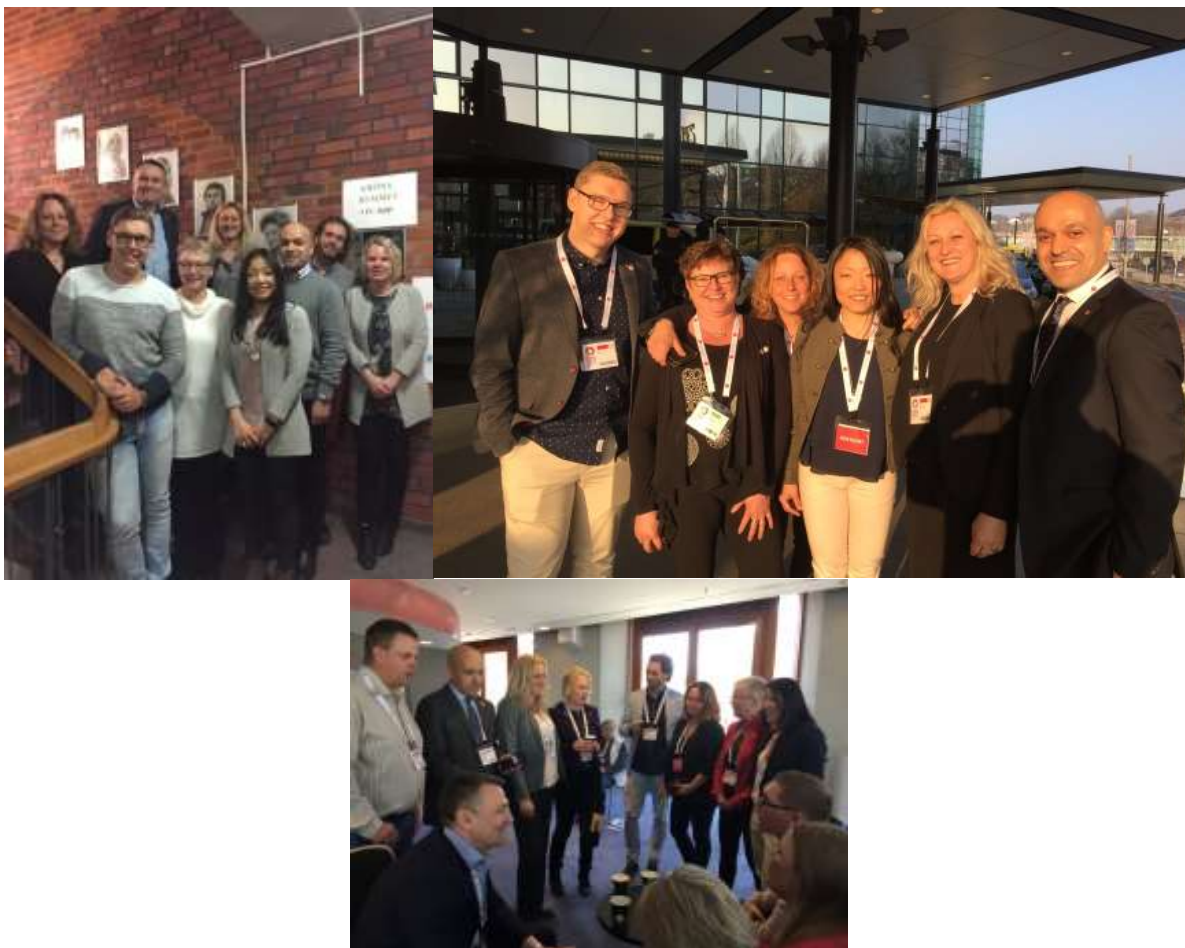
Partikongressen i Göteborg