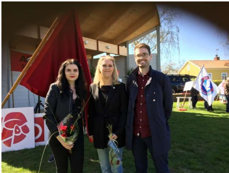
Första maj i Borgholm