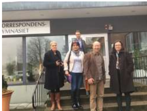
Anna Ekström i Torsås

9-10 mars besökte Anna Ekström Kalmar, Torsås och Emmaboda. Besök på Lars Kagg och Korrespondent gymnasiet, det öppna mötet fick avsluta dag ett.