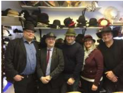
Sven-Erik Bucht i Högsby

8 mars besökte Sven-Erik Bucht Blomstermåla och Högsby. Många besök blev det, Fågelfors Hattateljé, lanthandeln i Fliseryd, möbler och inredning i Ålem samt lunch med lokal politiker. Dagen avslutades med ett öppet möte i Blomstermåla.