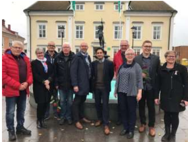
Ardalan Shekarabi i Vimmerby

Träff med gymnasieelever, poliser, besök på Vimmerby hälsocentral, rosutdelning och öppet möte stod bland annat på programmet.